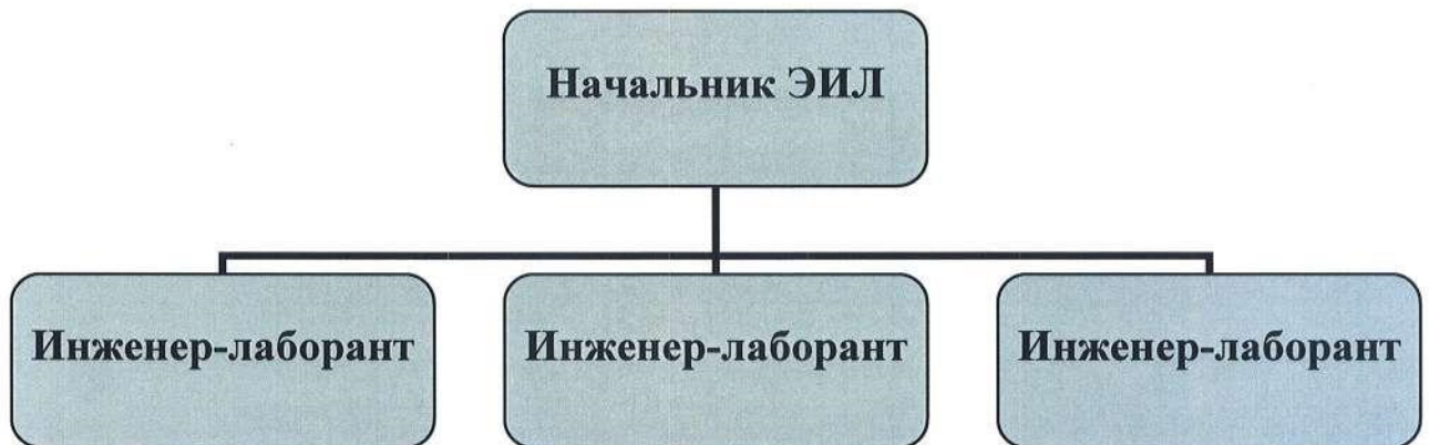
СХЕМА СТРУКТУРЫ ЭКОЛОГИЧЕСКОЙ (ИСПЫТАТЕЛЬНОЙ) ЛАБОРАТОРИИ

ДОКУМЕНТ ПОДПИСАН ЭЛЕКТРОННОЙ ПОДПИСЬЮ Сертификат: 00C85015D93CD41063CB7C34B53DAA5DE3 Владелец: Шешукова Ольга Александровна Действителен: с 22.05.2023 до 14.08.2024